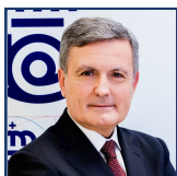
Presidente Pedro Saura García

Correos cuenta con un equipo experimentado y polivalente para gestionar, con el éxito que demuestran las cifras, una empresa de estas dimensiones, trazar sus líneas estratégicas y convertirla en un referente del sector logístico.